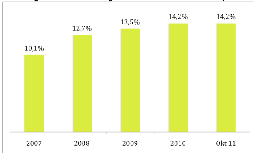
Abbildung 2: Anteil Fondsanleger mit einem Mischfonds im Depot

Die Daten beziehen sich jeweils auf den 31.12. eines Jahres bzw. auf den 31.10.2011